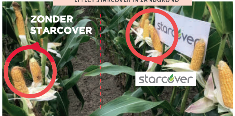
EFFECT STARCOVER IN ZANDGROND

Op de foto ziet u een perceel maïs op een zeer droogtegevoelige zandgrond. De kolven van de planten met de Starcovercoating zijn duidelijk veel beter ontwikkeld dan deze zonder Starcover.