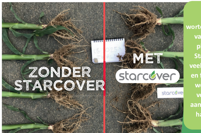
30.258 op 14 juni in Zwalm

Bij de wortelontwikkeling valt op dat de planten met Starcover een veel uitgebreider en fijner vertakt wortelpakket vormen met aanzienlijk meer haarwortels.